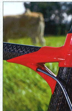
BMC-typische Optik: Auffällige Verbindung zwischen Ober- und Sitzrohr.