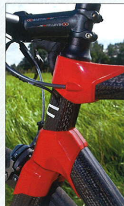
Impec-Merkmal: Wichtige Knotenpunkte am Rahmen.

präzise, gelassene Handling gefallen besonders auf langen Eappen, der Rahmen wirkte zudem komfortabel. Das Testrad mit Dura-Ace Di2 und Mavic Cosmic SLR wog ca. 7,3 kg. Preis dieser Ausstattungsvariante: um 11 000 Euro. www.bmc-racing.com